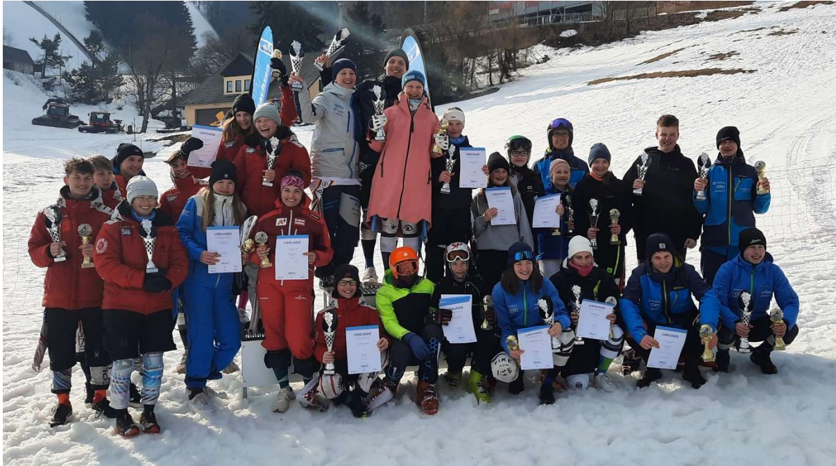
glückliche Sieger und Platzierte aller Vereine!

Ein Dankeschön an alle ausrichtenden Vereine, die faire Wettkämpfe für alle Sportler über die gesamte Saison ermöglicht haben. Besonderen Dank auch an die Eltern unseres Schülerteams, welche die Sportler während der Wettkämpfe von früh bis spät begleiteten und den Sportlern eine unvergessene Saison ermöglichten. Schade, dass sich unser Schülerteam auf ganz wenige Sportler beschränkte. Anhand der Ergebnisse sieht man, was auch ohne ausgiebigen Schneetraining möglich war. Dazu bedarf es dem Willen der Sportler und dem Engagement der Eltern. Wir hoffen nun, dass die neue Saison in unserer Region mal den erhofften Schnee bringt und wir eine Vielzahl von Nachwuchssportlern in unserem Verein begrüßen können.